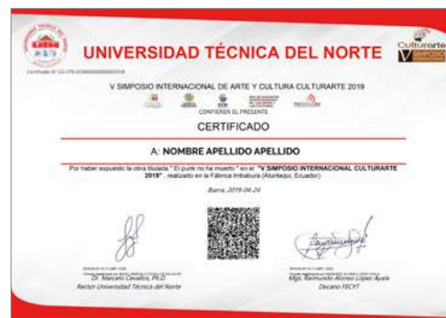
Certificado electrónico emitido con motivo del "V SIMPOSIO INTERNACIONAL CULTURARTE 2019".