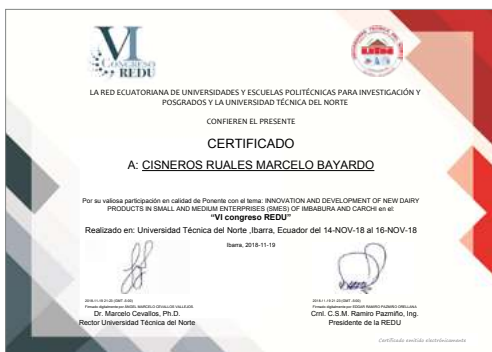
Certificado electrónico del primer evento en el que se emitieron certificados electrónicos "VI CONGRESO REDU".

Con relación a la emisión de certificados electrónicos, fue uno de los procesos que nació por el Congreso Internacional REDU realizado en el mes de noviembre de 2018, en el cual se emitieron 1098 certificados de participantes, ponentes, pósters, invitados y organizadores. A la presente fecha se han emitido en total 4053 certificados en 14 eventos diferentes.