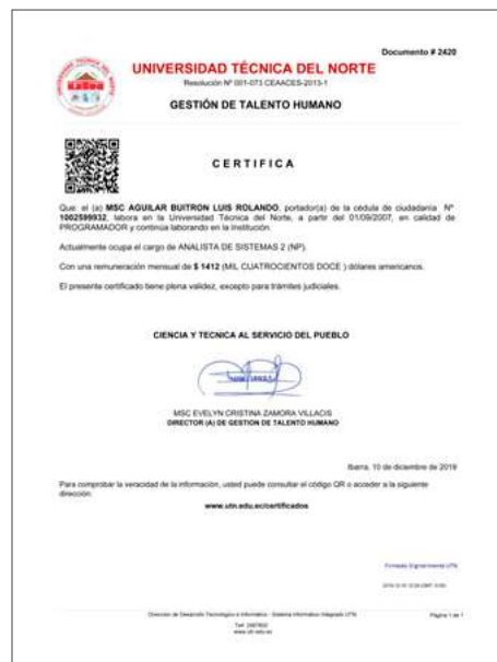
Ejemplo de certificado laboral.

En lo referente a las actividades de generación de certificados de trabajo e historia laboral, hemos acertado los tiempos de respuesta de horas e incluso en algunos casos días a segundos (5s – 7s). El empleado o docente universitario ya no necesita acercarse a la UTN, desde su portafolio electrónico y desde cualquier lugar del mundo lo puede generar y utilizarlo mientras el tiempo de vigencia lo permita.